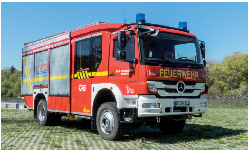
Hilfeleistungs-Löschgruppenfahrzeug HLF 20