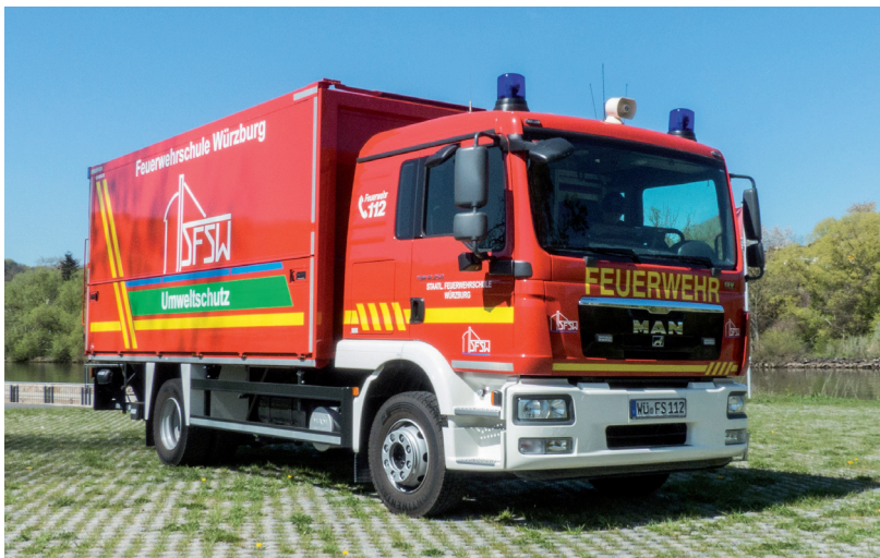
Gerätewagen Gefahrgut GW-G

Es sind vielerorts noch GW-G nach Baurichtlinie Bayern vorhanden. Ende der 80er Jahre wurden diese Fahrzeuge im Rahmen einer Landesbeschaffung flächendeckend stationiert (vgl. Tabelle 18 in der Anlage).