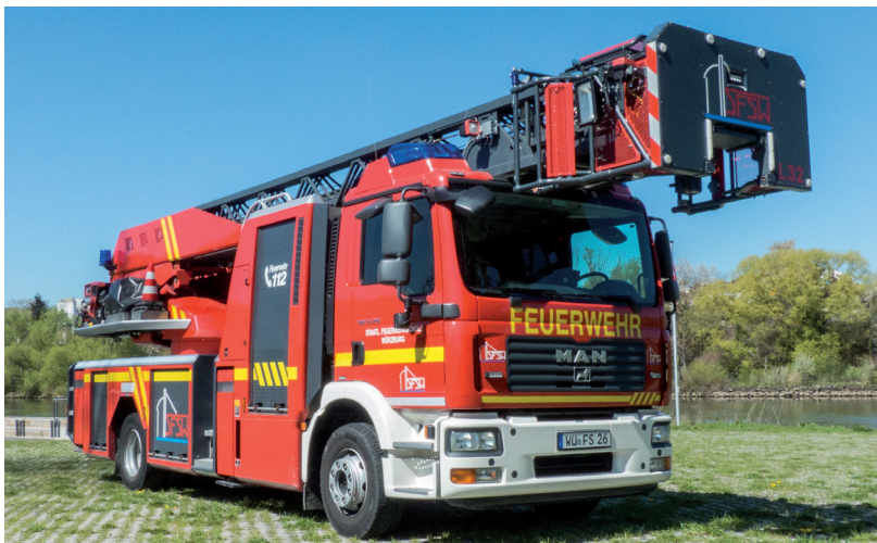
Drehleiter Automatik mit Korb DLA (K) 23/12

Die maximale Rettungshöhe ist aber nicht alleiniges Kriterium für die Leistungsfähigkeit einer Drehleiter.