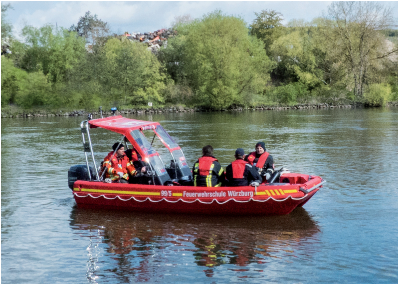
Rettungsboot Typ 2 RTB 2