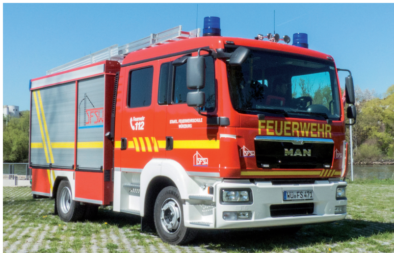
Mittleres Löschfahrzeug MLF

Sonderlöschfahrzeuge sind Feuerwehrfahrzeuge mit für die Brandbekämpfung spezieller Ausrüstung mit oder ohne speziellem Löschmittel, z. B. Trockentanklöschfahrzeug (TroTLF), Trockenlöschfahrzeug (TroLF). Hubrettungsfahrzeuge nach DIN EN 1846 sind Feuerwehrfahrzeuge, die mit einer Drehleiter oder einer Hubarbeitsbühne ausgerüstet sind.